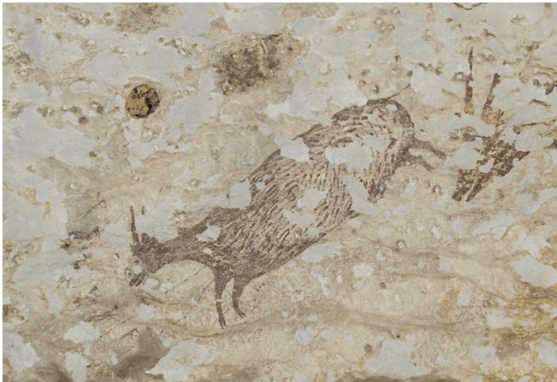
(圖一) 2019 年最新研究指出， 印尼蘇拉威西島 發現的一幅描繪史前狩獵場景的洞穴壁畫，可能是世界上最古老的具象藝術品(Figural Art)，年代可追溯至約 4,4000 年前。

下，倡議在整個藝術創作過程中，物料選擇、運輸工具及裝置方法等各方面，都應符合減碳減廢，資源再用的原則。至於作品主題可遍及不同範疇，除自然保育外，可持續發展這概念遍及生態學、教育、醫學、社會公義、道德抉擇、人文發展…等不同界別上。只要有機會失衡的地方，都有其可持續性的討論及關注空間，全皆可成為有深遠意義，令人省思的作品題材。