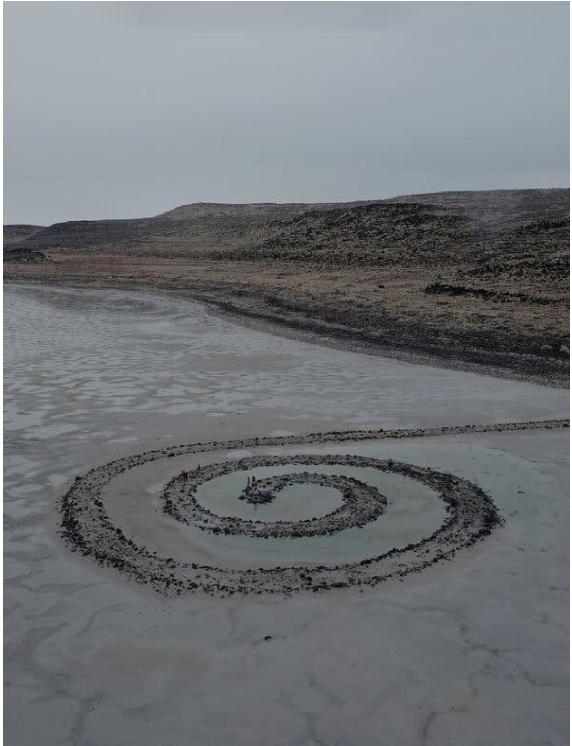
(圖二)1970年，羅伯特·史密森(Robert Smithson)在美國猶他州大鹽湖以玄武岩，鹽晶體，泥土及水建造的大型螺旋型雕塑《螺旋堤》(Spiral Jetty)。